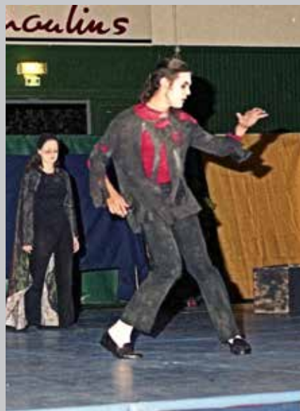
2000 Spectacle de danse « Michael Jackson »