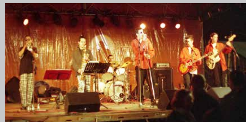
1997 Feelings au téléthon de Bourges