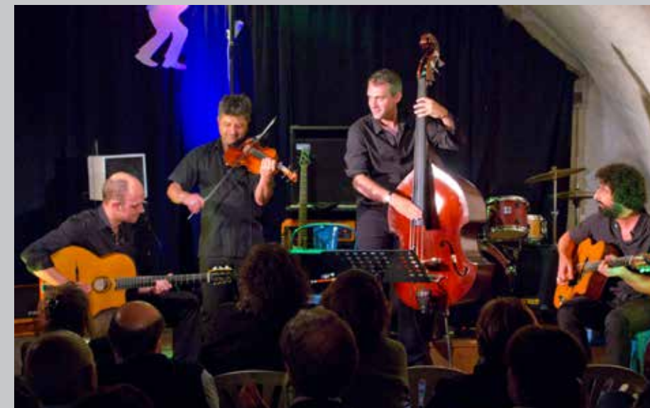
2013 La zongora au Jazz-Club Mouloinois