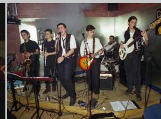
1997 Feelings Solex Café Moulins