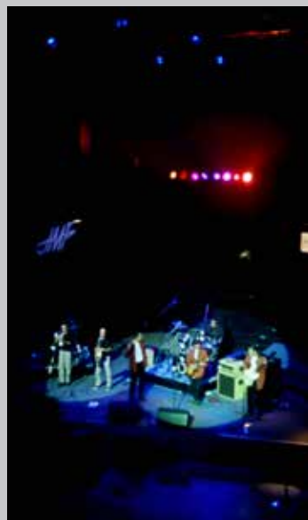
1998 Feelings au cirque d'hiver de Paris, invité par les J.M.F.