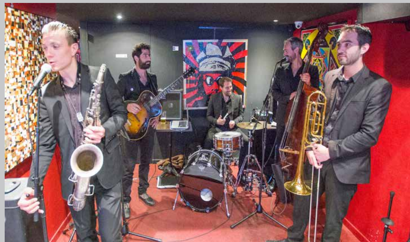
2017 au Strapontin