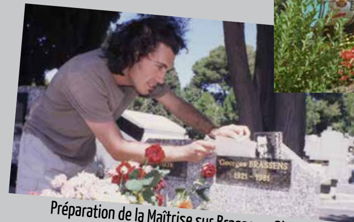
Préparation de la Maîtrise sur Brassens, Sète