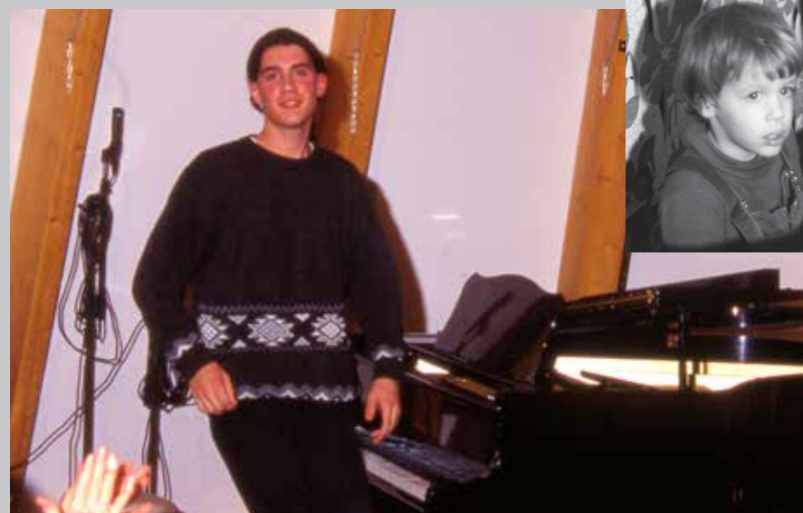
1996 concert à l'école de musique de Moulins