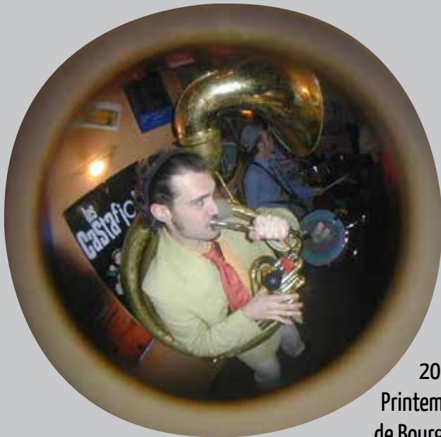
2004 Printemps de Bourges