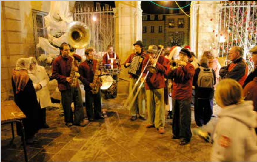
2004 Noël à Moulins