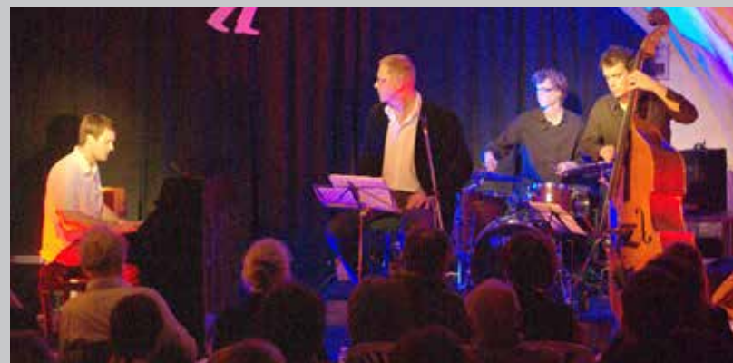
2010 Velvet Quartet au Jazz-Club Moulinois