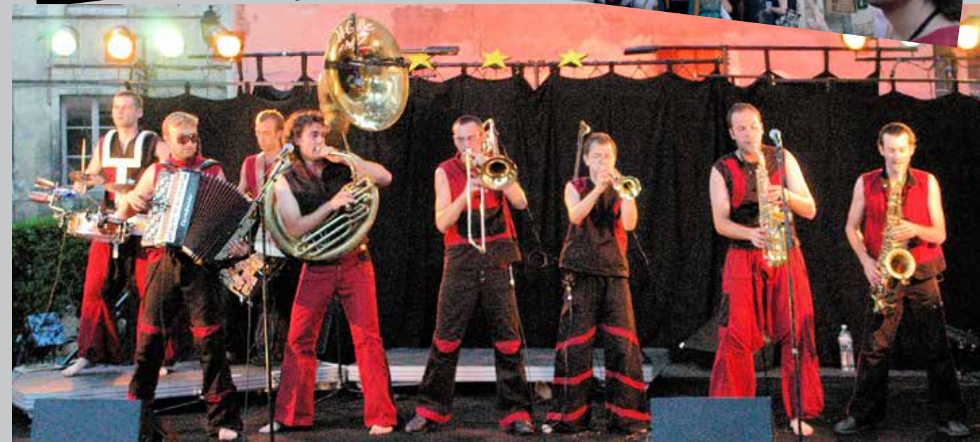
2007 Madamirma à la cave du Jazz-Club