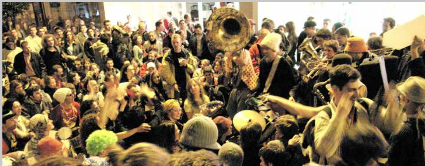
2005 Printemps de Bourges : Face à une immense banda qui descend l'avenue, la « Goutte au nez » se dispose, et, de manière totalement improvisée, prend la direction musicale d'une quarantaine de musiciens : un grand moment de musique !