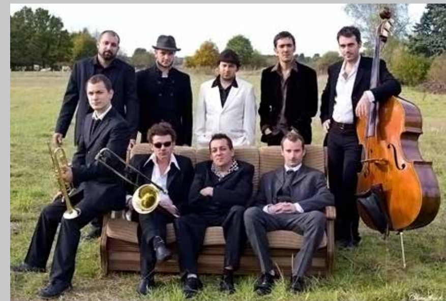
2011 Rude Boy System