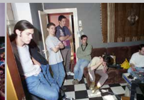
1997 Feelings enregistrement du premier disque