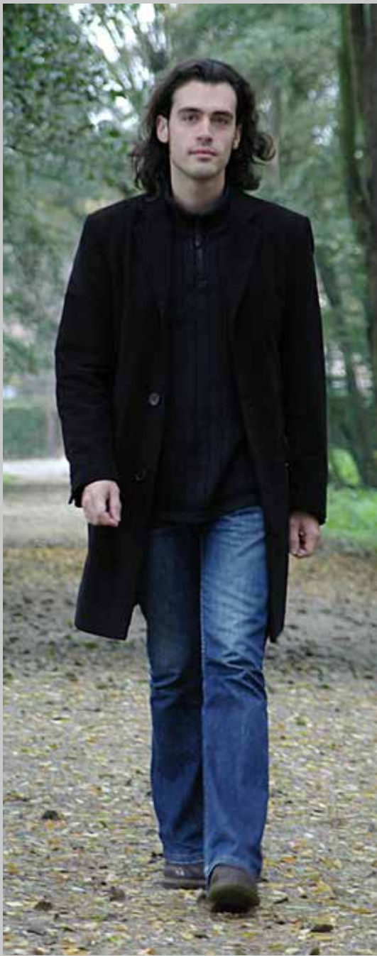
2004 Yzeure 2004 Festival de jazz de Nevers