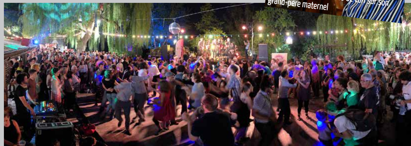
2014 The Swing Shouters à La guinguette de Tours, guest : Alex Bourguignon, soirée inoubliable !

Photogramme d'une vidéo de Carl sur son grand-père maternel