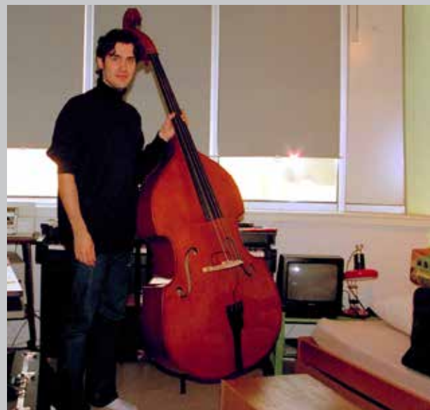
Premier logement à Tours