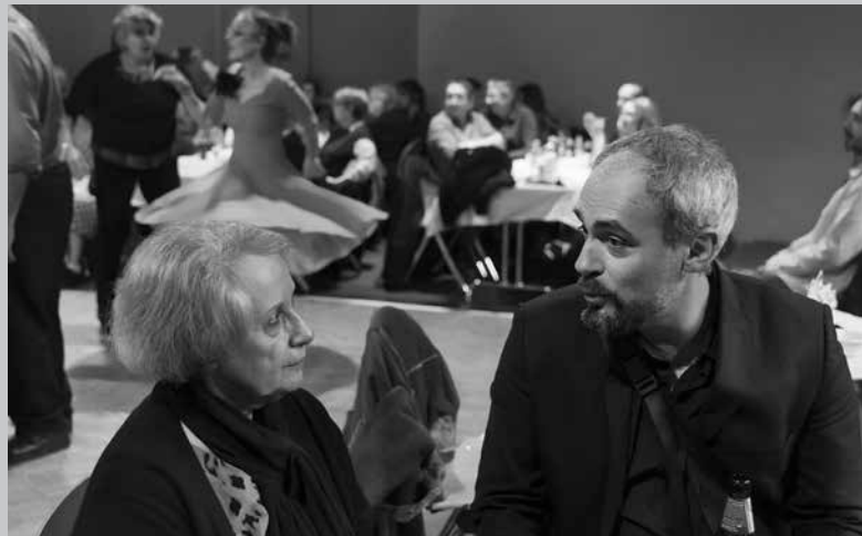
2025 bal swing avec sa tante