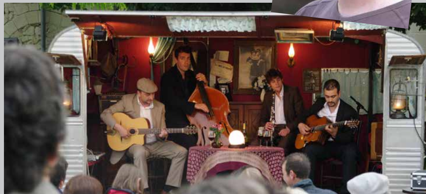
2009 La caravane Madamirma