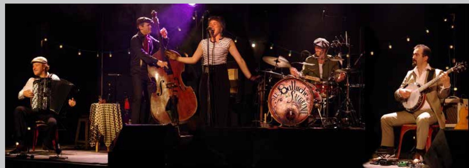
2012 Le Balluche de la Saugrenue