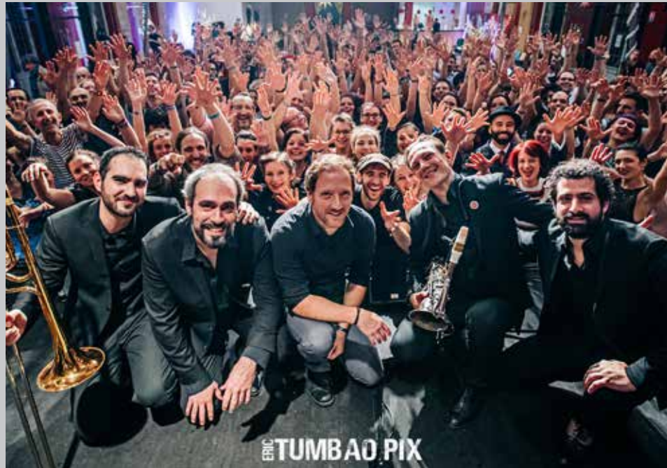
Figuration au cinéma