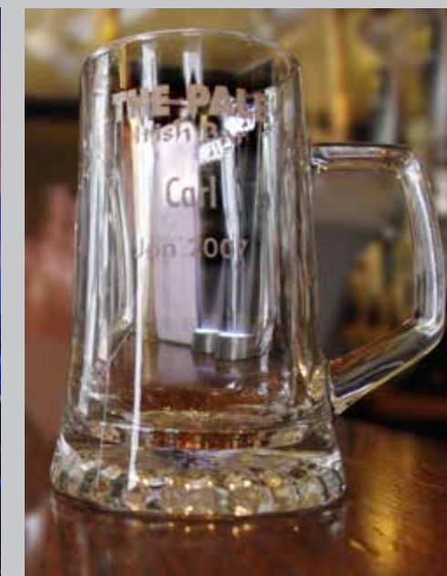
La Pinte officielle du « Pale », Irish Pub