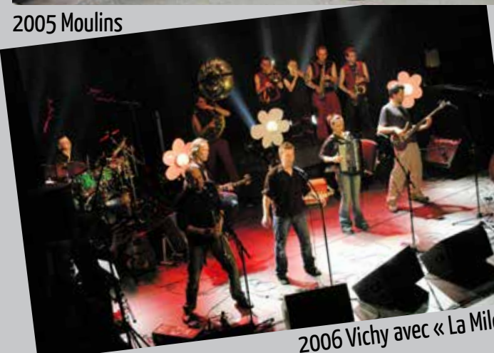
2006 Vichy avec « La Milca »