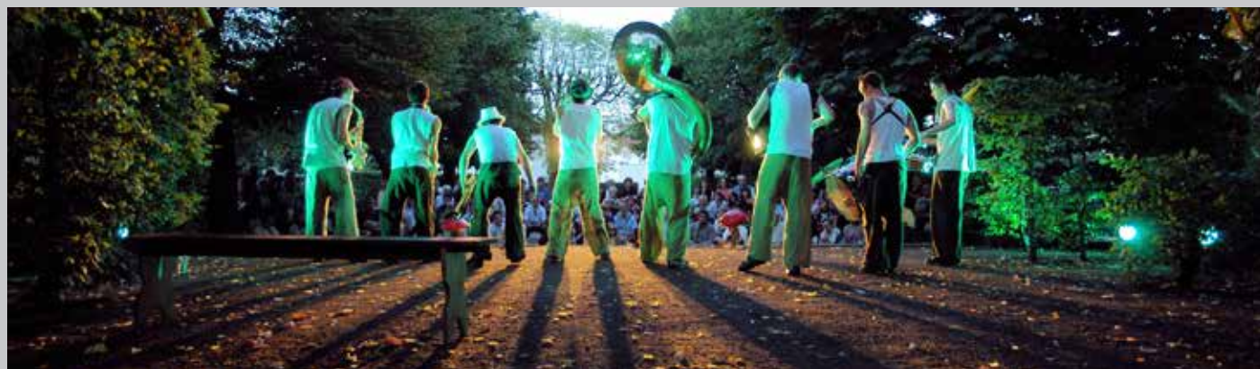
2005 Yzeure, théâtre de verdure