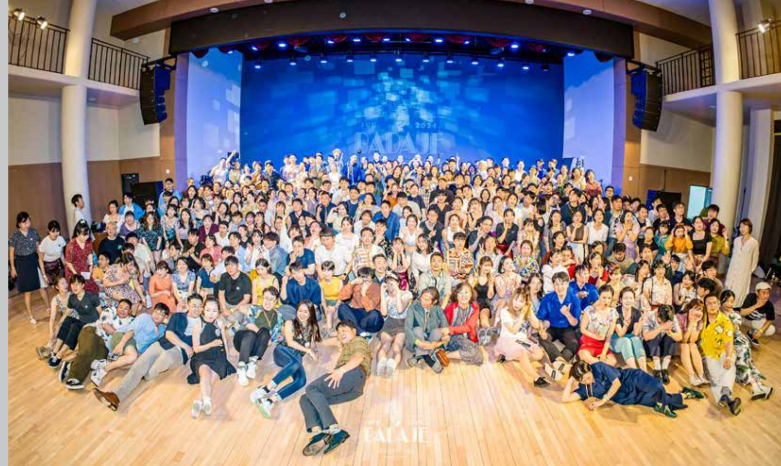
2024 Badaje, Corée