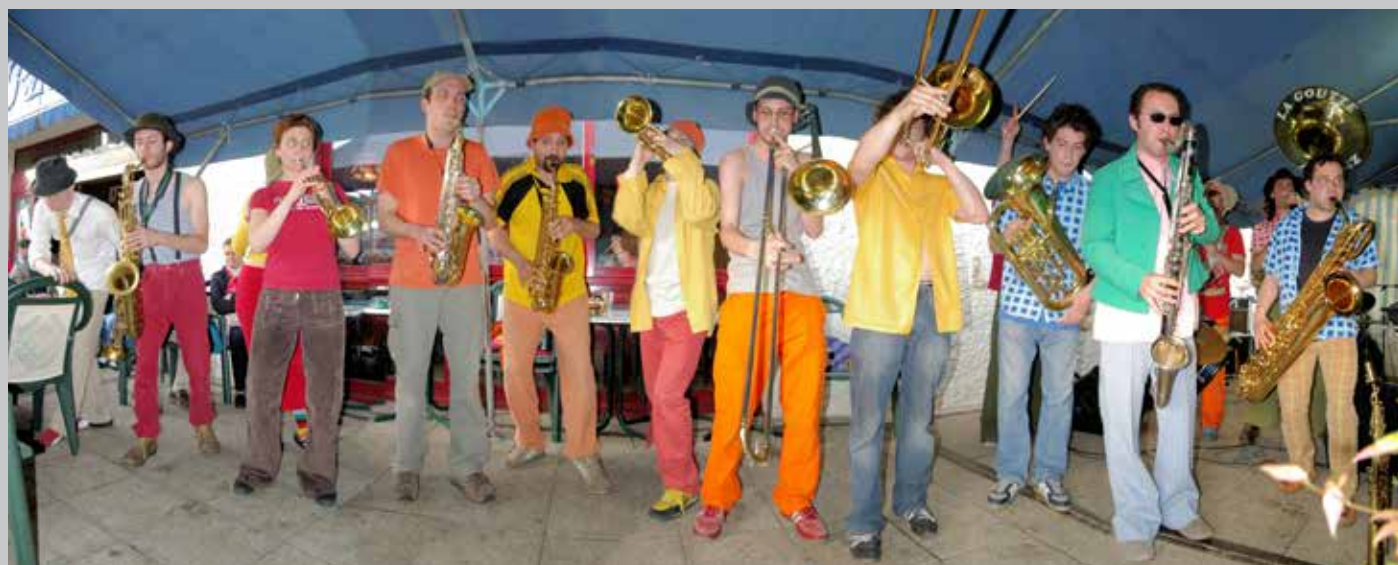
2005 Printemps de Bourges