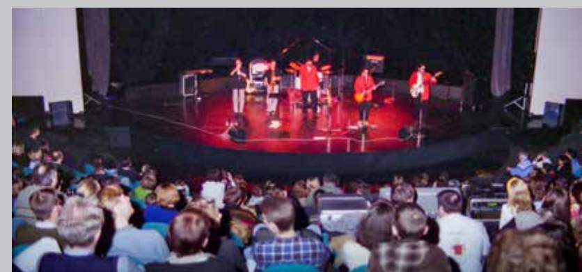
1997 Feelings Yzeurespace