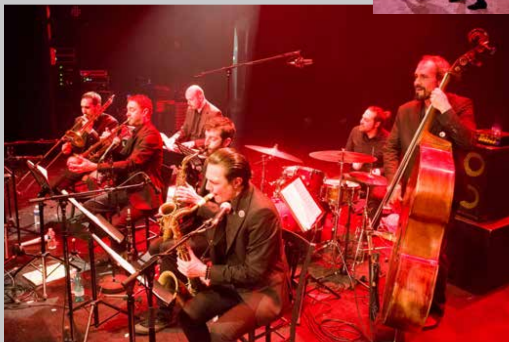
2020 Little Band à Avermes