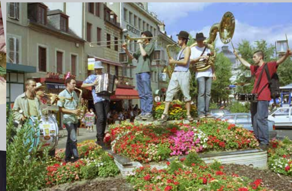
2003 La Goutte au Nez, festival de jazz de Moulins