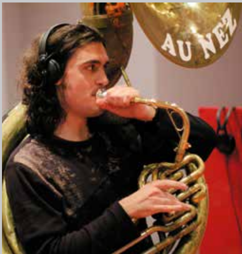
2004 séance d'enregistrement à Yzeure